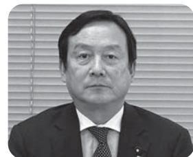
うかい雅彦 港区議会 議長