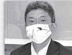
二島 豊司 港区議会 議長