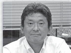
二島 豊司 港区議会 議長