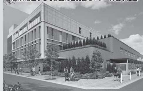
(仮称)港区子ども家庭総合支援センター外観予定図

子ども家庭支援センター、児童相談所、母子生活支援施設の複合施設となる、(仮称)港区子ども家庭総合支援センターの開設に向け、この8月から建設が始まります。平成28年の児童福祉法改正により、これまで都道府県や政令指定都市のみが設置できた児童相談所が特別区にも設置できるようになりました。自民党議員団はこれまでも港区における児童相談所の必要性を説き、施設整備を主導して推進してきました。妊娠期から子どもの自立まで切れ目のない支援が実施されるよう、これからも協力していきます。